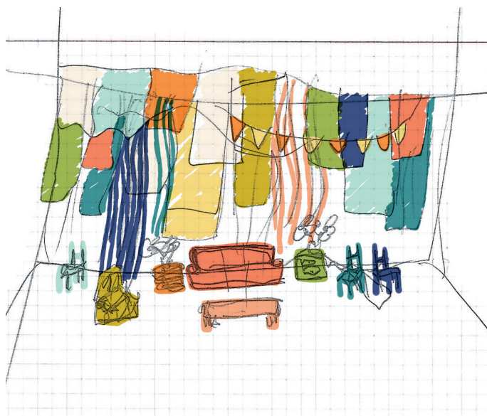
Croquis de la scénographie © Lemieux-Venne