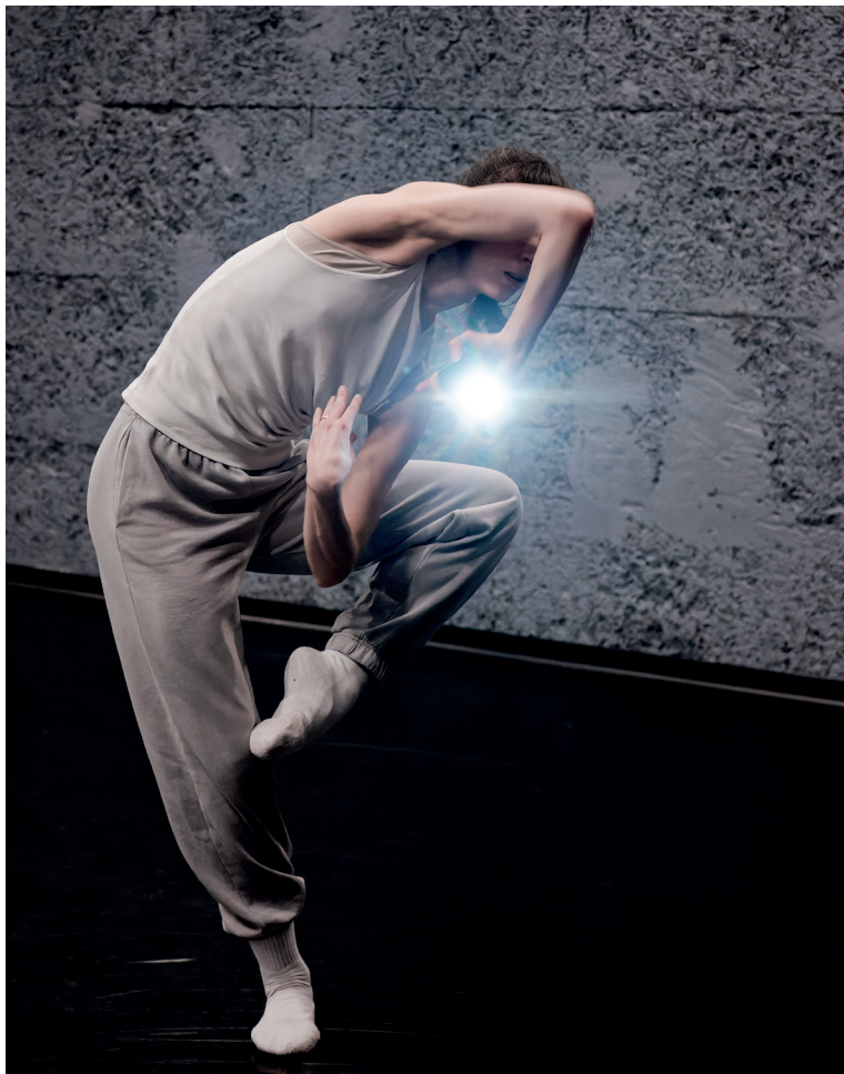
Rex , photo de répétition